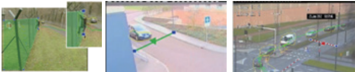
エリアの中に人が侵入した 指定のラインを車が通過した 指定のラインを通過した数をカウント